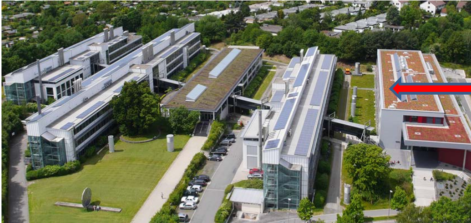
NW III, 2. Obergeschoss